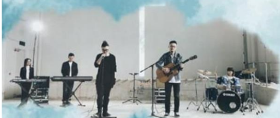
樂隊 | Milk & Honey