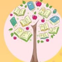
完成閱讀，畫出彩虹 Draw a Rainbow