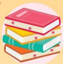
癌症資訊 Cancer Info

WE ARE HERE, TO SUPPORT YOU IN A POSITIVE WAY!