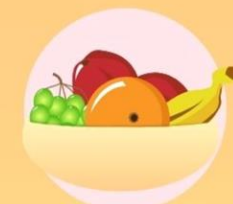
營養及食療資訊 Diet Advice