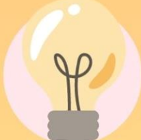
社區資源 Community Resources