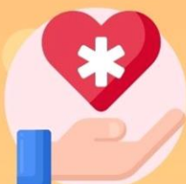
紓緩治療 Palliative Care