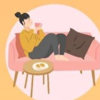
放鬆貼士 Relaxation Tips