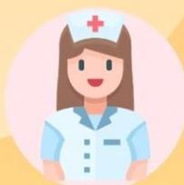
安寧服務 Hospice Care