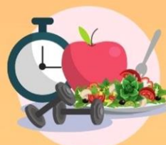
健康管理 Health Management